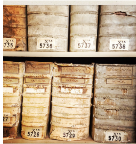
Les grands dépôts des Archives nationales

Ce livre tend à faire revivre la dramaturgie de ces procès comme si on y assistait : les pièces sont reproduites en fac-similé, les extraits significatifs sont grossis, des portraits de femmes viennent en regard, on plonge dans leur vie.